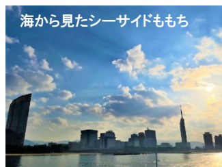
海から見たシーサイドももち