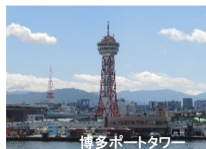
博多ポートタワー

展望室からは、博多港に浮かぶ島々や港を行き交う船、活気あふれる福岡のまちなど、360度の 大パノラマ(風景) をお楽しみいただけます。