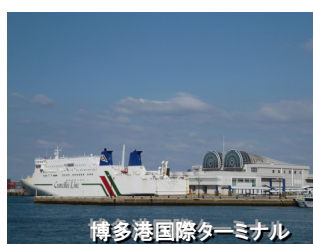
博多港国際ターミナル