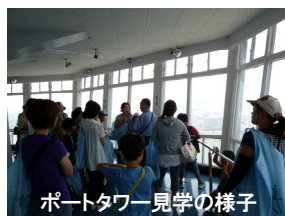
ポートタワー見学の様子

開館時間／10時～20時(入場は19時40分まで) ※水曜日、年末年始(12月29日～1月3日)休館 福岡市博多区築港本町14-1 ☎092-291-0573