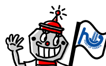
博多港のマスコットキャラクター『ポートくん』

問い合わせ先 一般社団法人博多港振興協会 担当：脇 〒812-0031 福岡市博多区沖浜町 12-1 電話：092-271-1378 FAX：092-282-4757