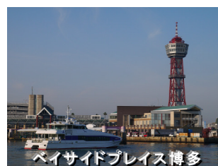
バイサイドプレイス博多