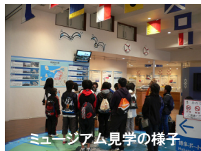
ミュージアム見学の様子

開館時間／10時～20時(入場は19時40分まで) ※水曜日、年末年始(12月29日～1月3日)休館 福岡市博多区築港本町14-1 ☎092-282-5811