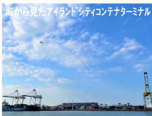
海から見たアイランドシティコンテナターミナル