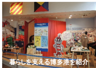
暮らしを支える博多港を紹介

パネルや模型などを展示し、博多港の役割や歴史などを、わかりやすく紹介しています。